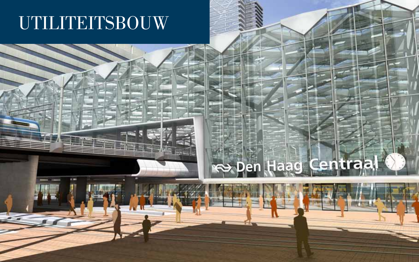
Gevel en dak gaan naadloos in elkaar over.

Tekst | Jan-Kees Verschuure Beeld | Benthem Crouwel Architecten/ProRail, Stefan Verkerk